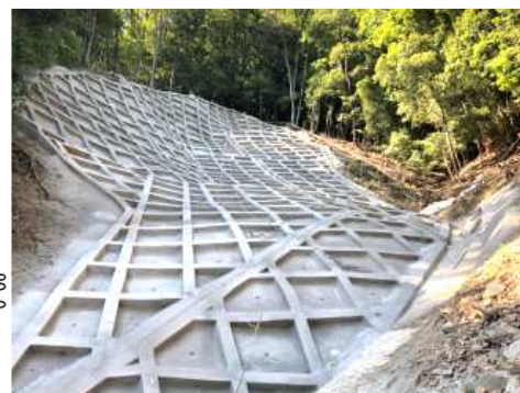
工事完了 （令和2年6月25日）

設計：復建調査設計株式会社 施工：エヌエル産業株式会社 発注：西部建設事務所東広島支所