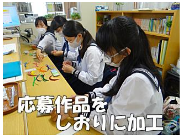
応募作品を しおりに加工