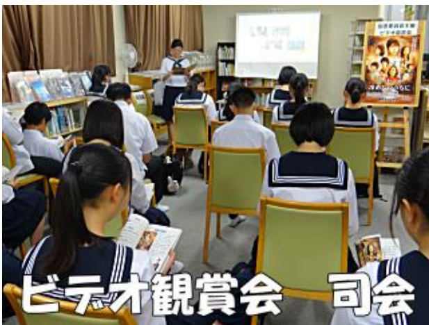
ビデオ観賞会 司会