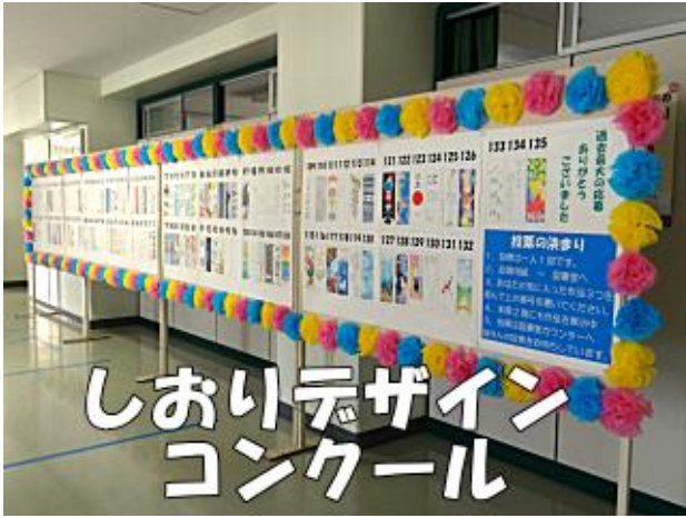
しおりデザイン コンクール