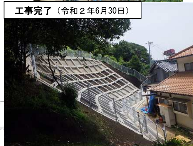
工事完了（令和2年6月30日）

設計：日本工営株式会社 施工：エヌエル産業株式会社 発注：西部建設事務所東広島支所