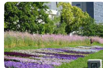
(現在、花の植え替えを行っています。)

広島は、街の中にくつもの川が流れる水の都です。ここでは、本川(旧太田川)の雄大な風景の中で、水辺散策や憩うことができます。