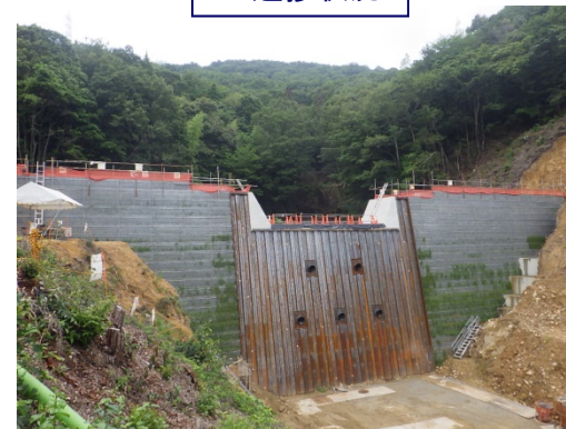
工事完了（令和2年7月30日）