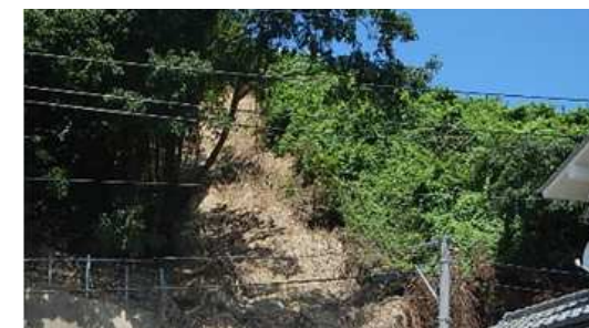
工事完了（令和2年7月31日）