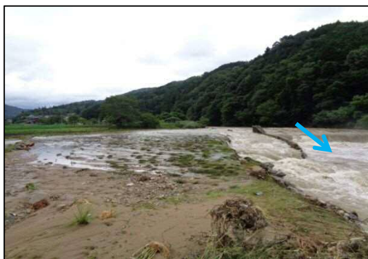
三篠川 (広島市安佐北区白木町井原)