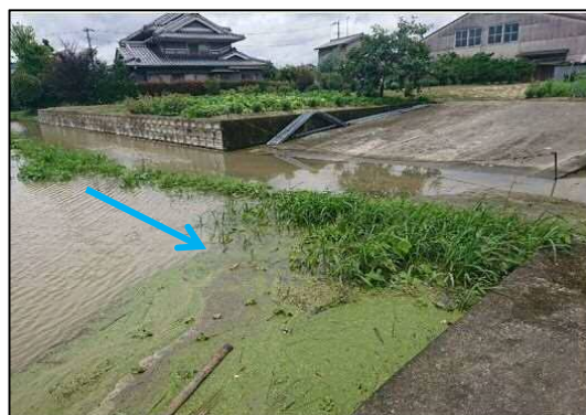
西谷川 (福山市駅家町)