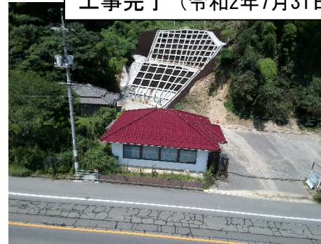
工事完了（令和2年7月31日）