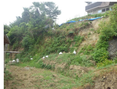
斜面崩壊・被災状況（平成30年8月）