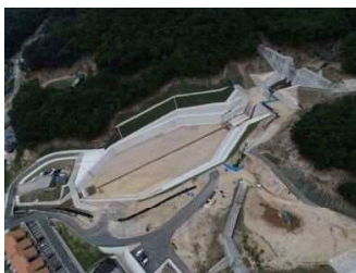
国砂防事業 303 溪流 (安佐南区八木 3 丁目)