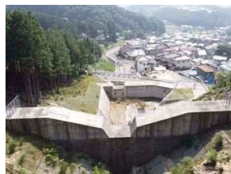
県砂防事業 根谷川支川 101 (安佐北区可部東 6 丁目)