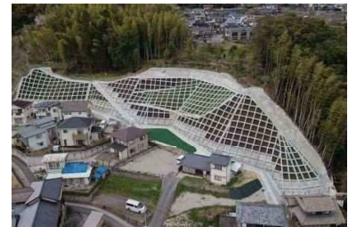
県急傾斜事業 山本 8 丁目 26 地区 (安佐南区山本 8 丁目)