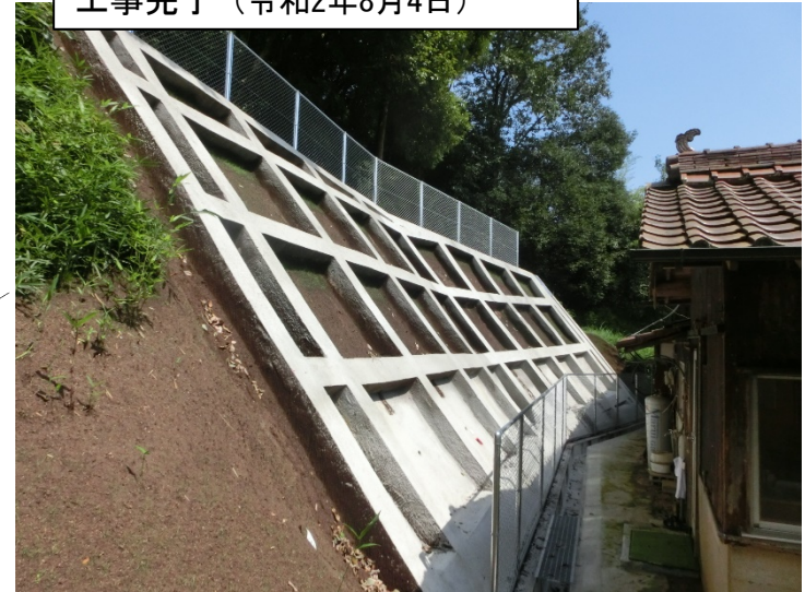
工事完了（令和2年8月4日）