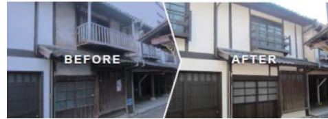
<伝統的建造物の保存修理の例>