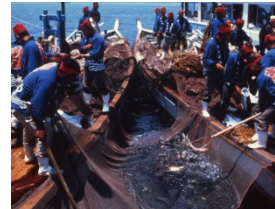
<鞆の浦鯛しばり網漁法>