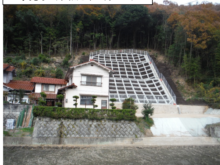
工事完了 (令和元年11月26日)