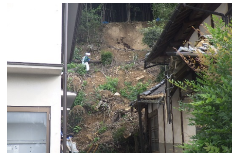
斜面崩壊・被災状況 (H30年7月)