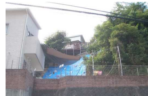
斜面崩壊・被災状況（H30年7月）