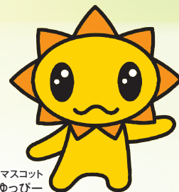
広島県の青少年のマスコット ゆっぴー