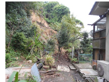
斜面崩壊・被災状況（平成30年7月）