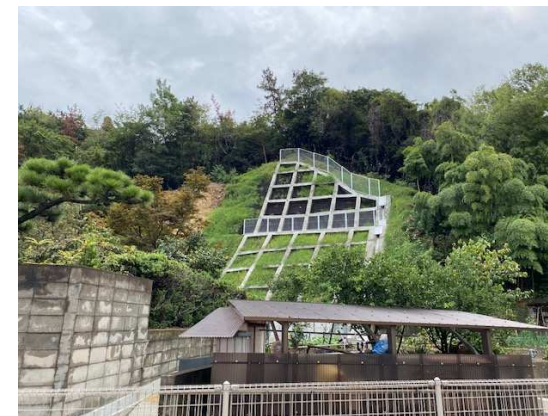
工事完了（令和2年9月30日）