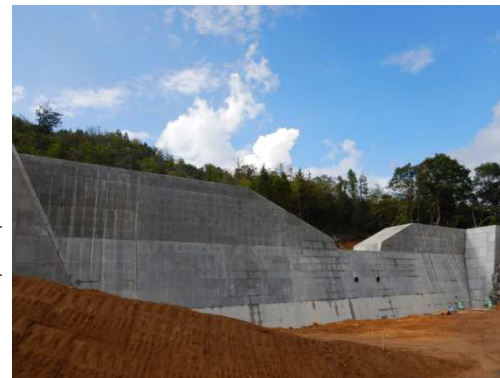
工事完了（令和2年9月30日）

設計：株式会社オリエンタルコンサルタンツ 施工：株式会社後藤組 発注：西部建設事務所東広島支所