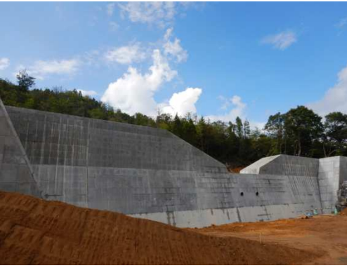
工事完了（令和2年9月30日）

設計：株式会社オリエンタルコンサルタンツ 施工：株式会社後藤組 発注：西部建設事務所東広島支所