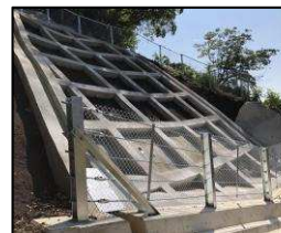
工事完了（令和2年10月5日）