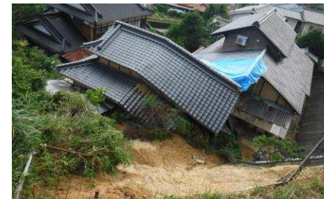
斜面崩壊・被災状況（H30年7月）