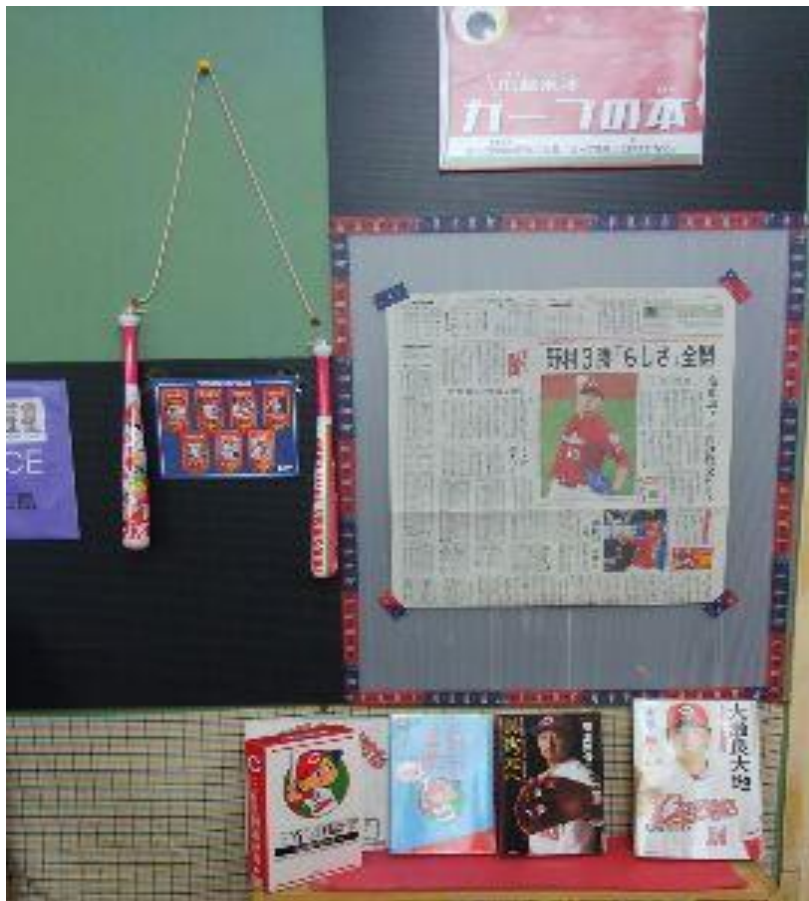
カープが勝つと、翌日新聞を貼る コーナーを作成