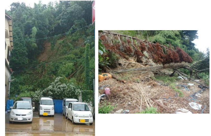
斜面崩壊・被災状況（平成30年7月）