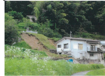
斜面崩壊・被災状況（平成30年8月）