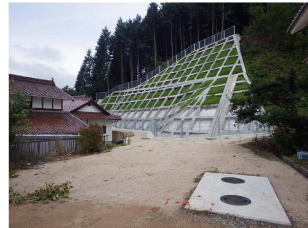
工事完了（令和2年10月5日）