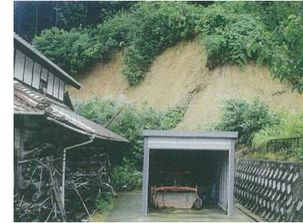
斜面崩壊・被災状況（平成30年8月）