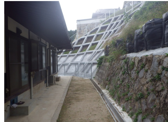
工事完了（令和2年9月30日）