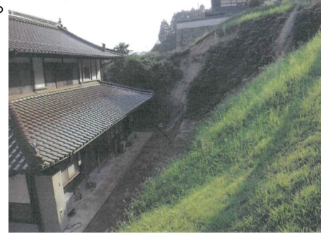
斜面崩壊・被災状況（平成30年8月）