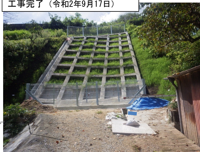
工事完了（令和2年9月17日）