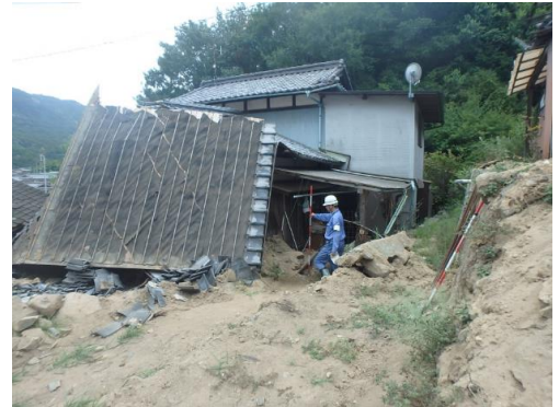
工事完了（令和元年11月25日）