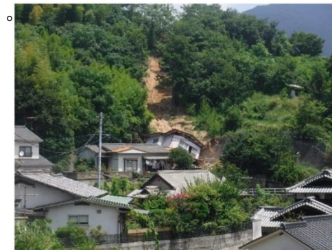
斜面崩壊・被災状況（H30年7月）