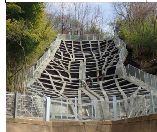
工事完了（令和2年3月19日）

設計：復建調査設計株式会社 施工：株式会社大竹山工業所 発注：西部建設事務所呉支所