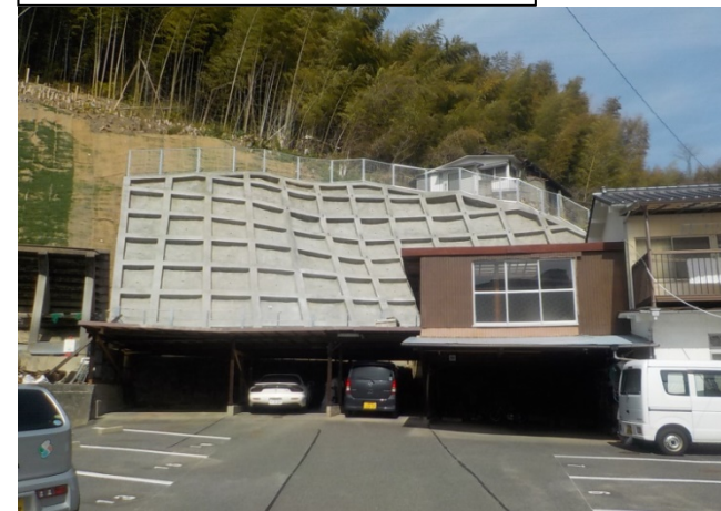
工事完了（令和2年3月13日）