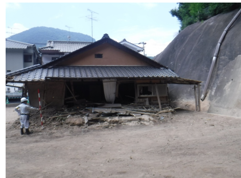
工事完了（令和元年11月14日）