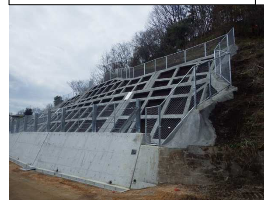
工事完了（令和2年3月19日）