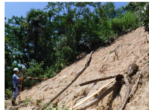
斜面崩壊・被災状況（H30年7月）