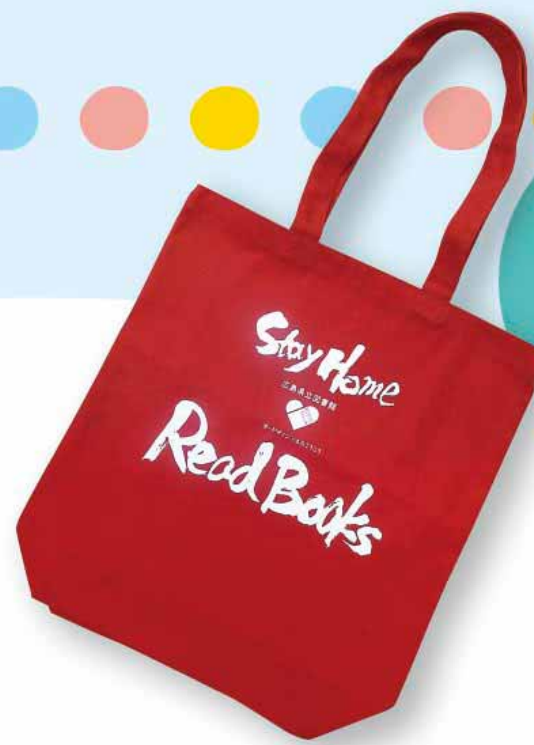
プロジェクト キャンペーン トートバッグ

この取組は、学校が臨時休業中の子供たちの学びを支援する「図書貸出事業」として始まりました。学校再開後も長引くコロナ禍で不安やストレスを抱える子供たちが多く考えられます。本は、癒し・悩みの解決や生き方のヒント・学びなど、心の元気をチャージしてくれます。ぜひ、ご活用ください。