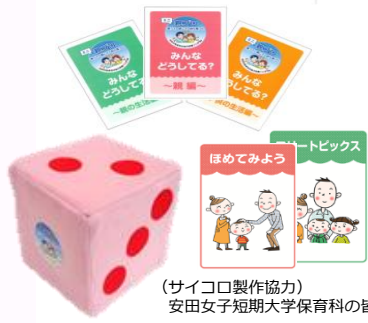
(サイコロ製作協力) 安田女子短期大学保育科の皆さん

「親プロ」は 広島県教育委員会が開発した “寄って 話して 自ら気づく” 参加型の学習 プログラムです