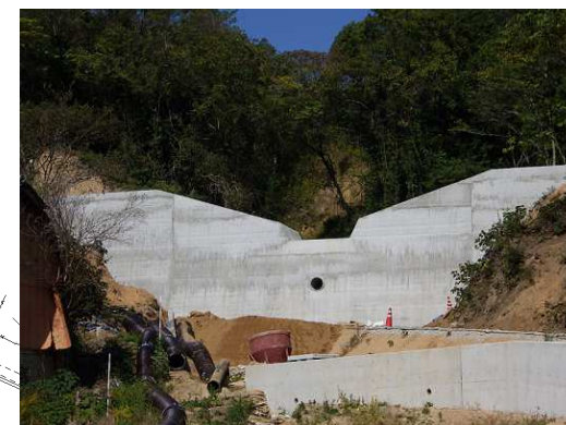
堰堤工事完了（令和2年10月30日）