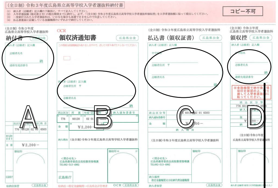
< 県立高等学校入学者選抜料納付書 >