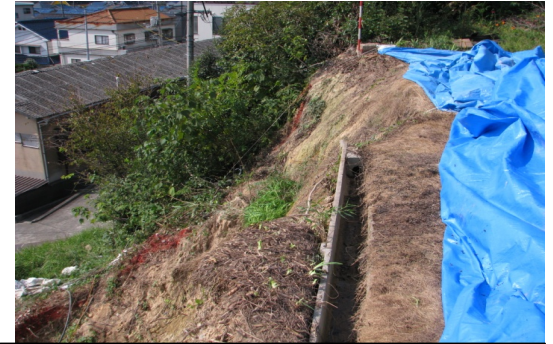
斜面崩壊・被災状況（H30年7月）