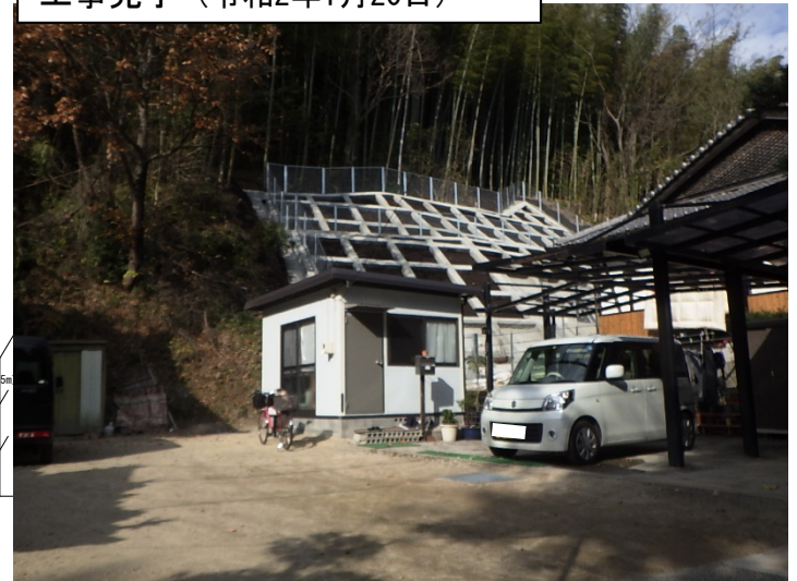
工事完了（令和2年1月20日）