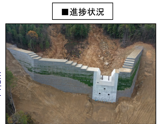
工事完了（令和2年11月27日）