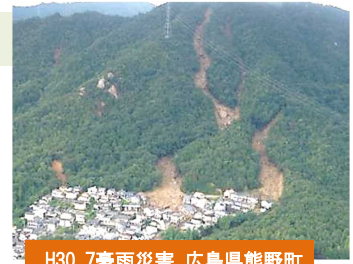
H30.7豪雨災害 広島県熊野町

【現状】 災害→用地取得困難→収用手続→事業認定・裁決→工事・復旧完了 ～約3年 【提案】 災害→用地取得4/5以上→残りの権利者の補償金は供託→工事・復旧完了～3か月