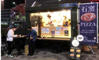
出典：新型コロナウイルス対策としての路上販売店舗 (令和2年 オープンバル)