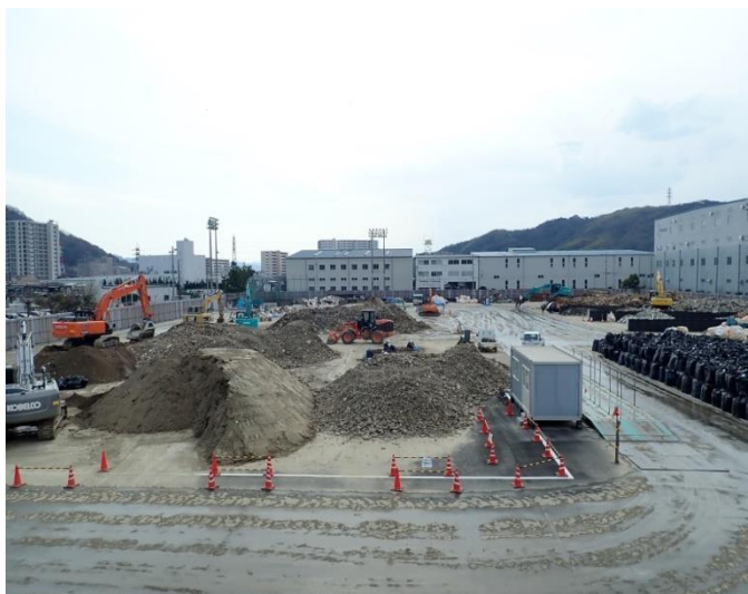
○ 坂町 北新地運動公園（処理中）