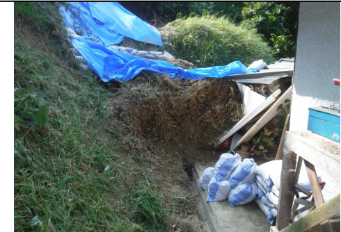
工事完了（令和2年12月9日）