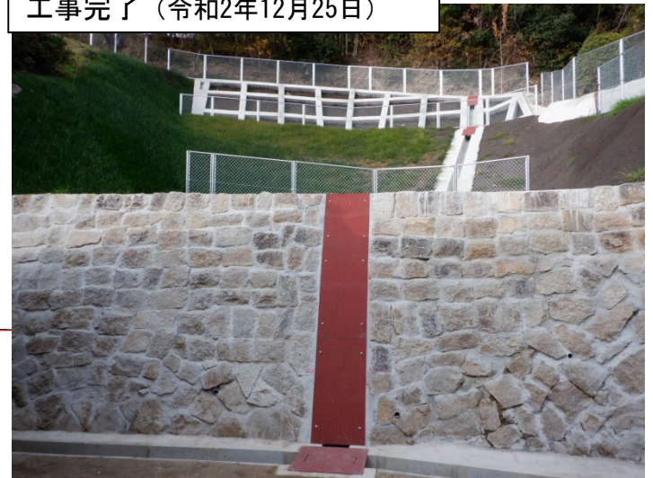
工事完了（令和2年12月25日）