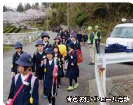
青色防犯パトロール活動