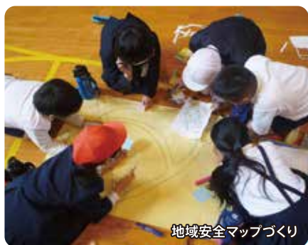
地域安全マップづくり