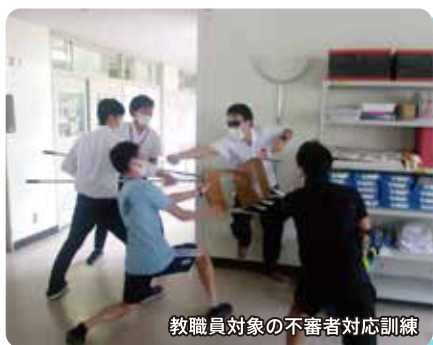
教職員対象の不審者対応訓練