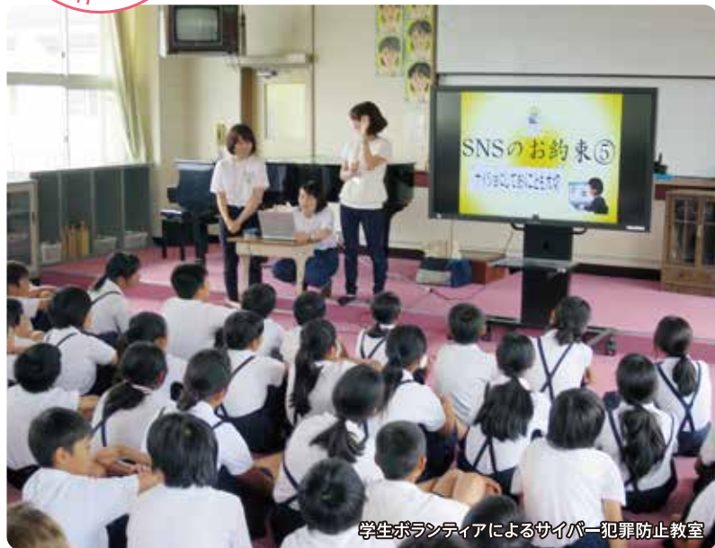
学生ボランティアによるサイバー犯罪防止教室

積極的な広報啓発や犯罪・防犯に関する情報発信により、県民の関心と理解を深めるとともに、県民一人一人の防犯意識と規範意識を高め、県民自らが危険を察知し回避できる「犯罪抵抗力」の向上を図ります。