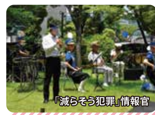
「減らそう犯罪」情報官