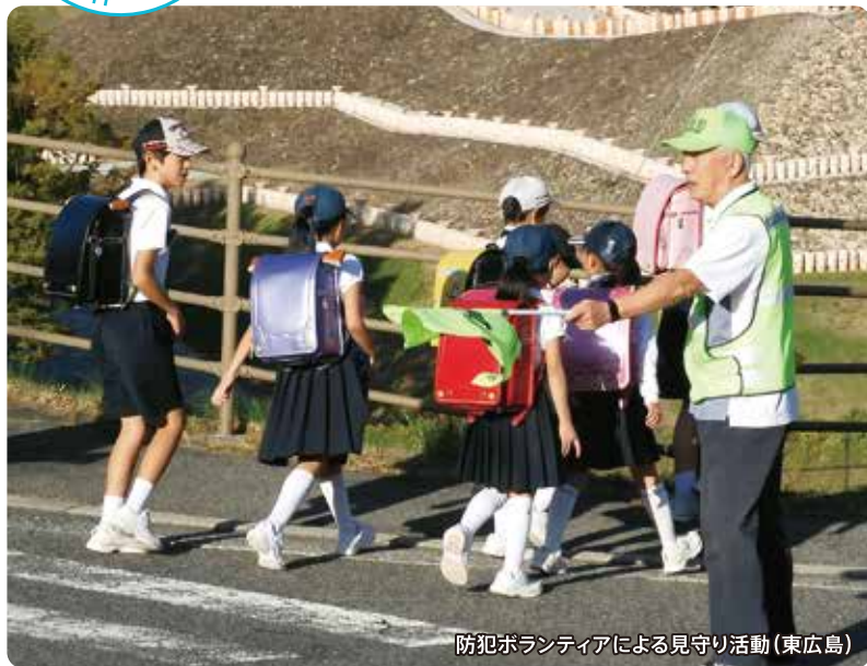
防犯ボランティアによる見守り活動(東広島)

地域のボランティア、関係団体、事業者等と協力しながら、新たな課題に対応した取組を推進。地域で暮らす人々が互いに見守り、支え合う、“見守り機能”を再生・強化し、地域の「犯罪抑止力」の向上を図ります。