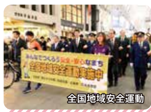
全国地域安全運動