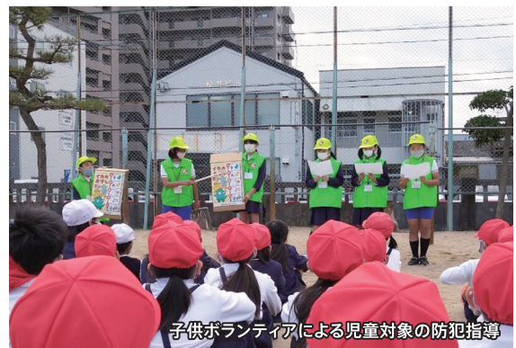
子供ボランティアによる児童対象の防犯指導