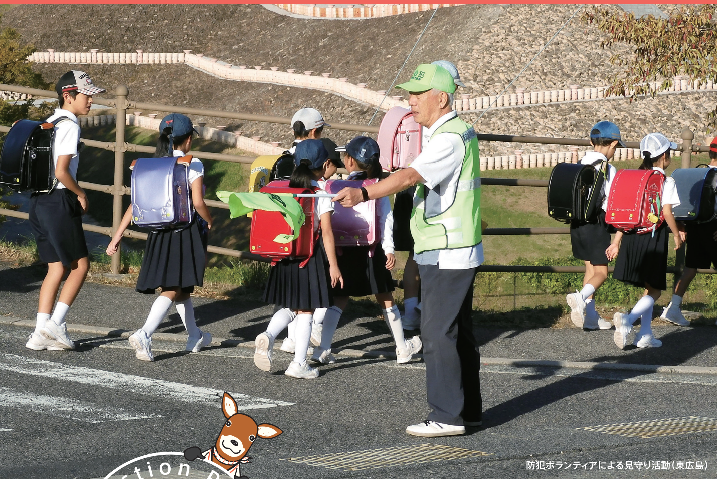
防犯ボランティアによる見守り活動(東広島)