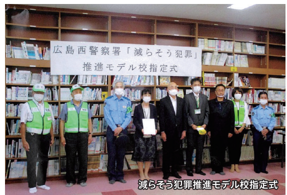
減らそう犯罪推進モデル校指定式