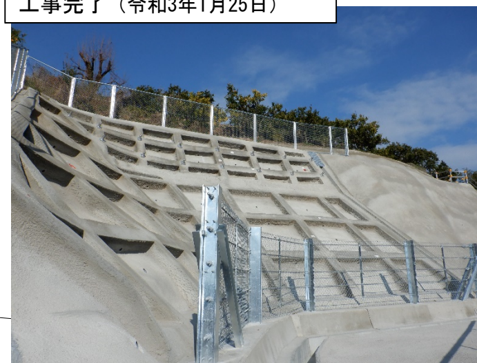
工事完了（令和3年1月25日）