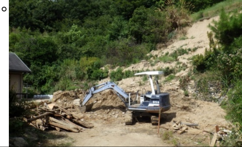
斜面崩壊・被災状況（H30年7月）