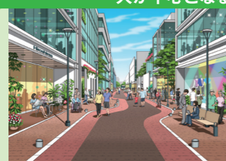
歩いて楽しい人中心のまち