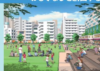
リビングのような公園