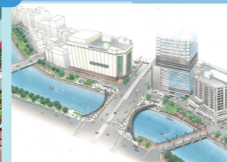
水の都ひろしまにふさわしい水辺