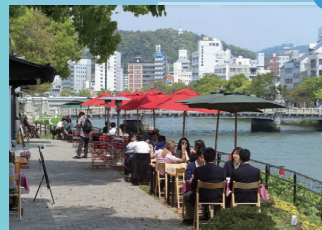
水と緑にふれることができるまち