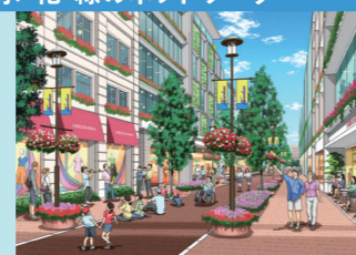
花と緑と音楽のあふれるまち