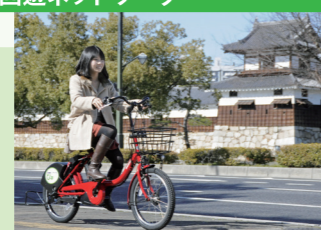
誰もが快適にめぐることができるまち