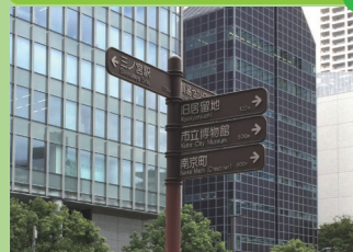
誰もがスムーズに回遊できるまち