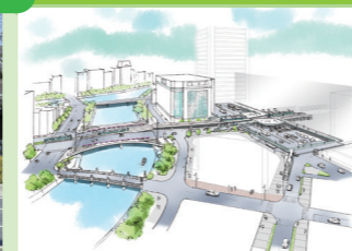
誰もが利用しやすい交通拠点