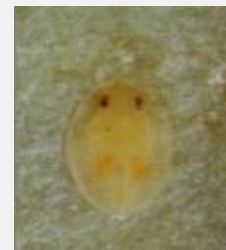
タバココナジラミ蛹