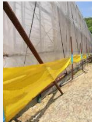
ハウス周辺への黄色粘着シート設置