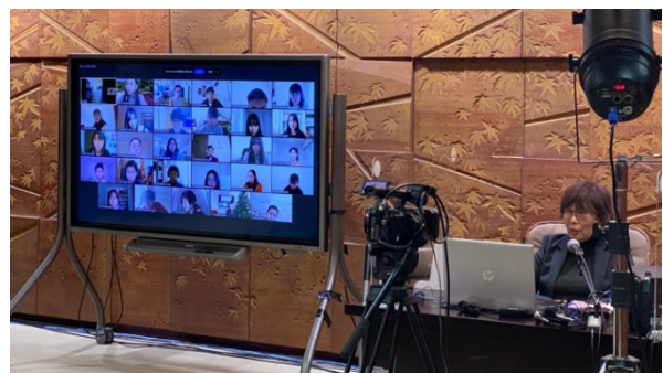
(被爆体験証言聴講)