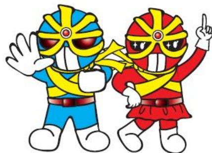
反射材活用促進キャラクター(広島県警)