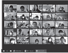
オンラインアイスブレイク

研修当日は、基本的な講義・演習のほか、仕事の楽しさややりがいを語る「トークセッション」、オンライン上での「アイスブレイク」や「オンラインランチ会」、参加型の「突然ですがクイズです！」タイム等の創意工夫を取り入れた。また、オリエンテーションでは、「カメラ・マイクのオン・オフ」「名前表示」「チャットの活用」等のオンライン集会の「ルール」のほか、「楽しみなながら、体験を通じて学ぶ」「失敗から学ぶ」「学んだことを生かす」等の研修で大切にしたい視点をメッセージとして提示した。これらの視点は、オンライン事業に関わる基本的な姿勢として、その後の研修でも改善しながら発信を続けている。