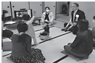
ハイブリッド型「親プロ」講座 (生涯学習フェスティバル)