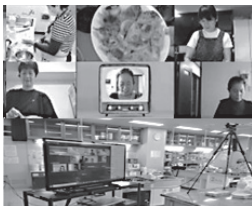
オンラインキッチン (リモコひろしま)